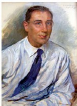
Портрет В.С. Мартыновского работы известной русской художницы З.Е. Серебрякой (Париж, 1961 г.)