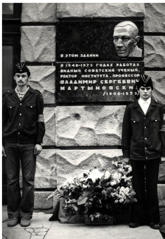
В память о В.С.Мартыновском на фасаде Академии холода установлена мемориальная доска.